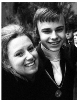
Deutscher Meister 1972

Literatur: Schönmetzler, Sepp und Thomas Moser, Eislauf, Eiskunstlauf, Eisschnellauf - Literatur. Wien 1986.