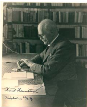
Nr. 39: Knut Hamsun

1841 Dem Herrn Franz Oppen Ich sende Ihnen gerüst die Photo von dem einzigen Bild welches echt ist. Die drei "metaphysischen" sind alle drei falsche Bilder, die wahrscheinlich aus Täuschung von mir. Ich muss die photos von den falschen Bildern behalten um 9 Bitt für mich. Namen. Ich kann schreiben von dem, als die jungen die Ihnen die falsche Bild angeboten haben. Ich habe keine hier, für Juni. Ich habe manche metaphysisch Bilder, wenn Sie kaufen wollen; aber Ich muss Ihnen sagen dass die Autentik die Ich hinter das Bild schreiben ist dass Ich das Bild gemacht habe und mein Name ist von meiner Hand geschrieben. Wenn jemand mein Name in welchem Jahr Ich das Bild gemacht habe dann antwort ich dass ein Bild ist ein Kunstwerk